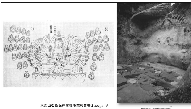
大悲山石仏保存修理事業報告書2025より