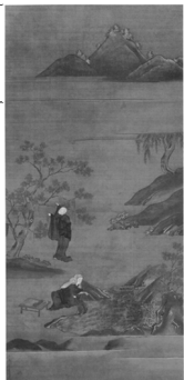
染井園 ツムラ記念館