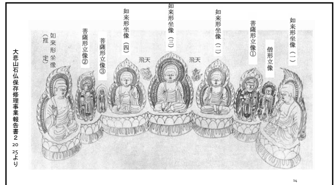
大悲山石仏保存修理事業報告書2025より