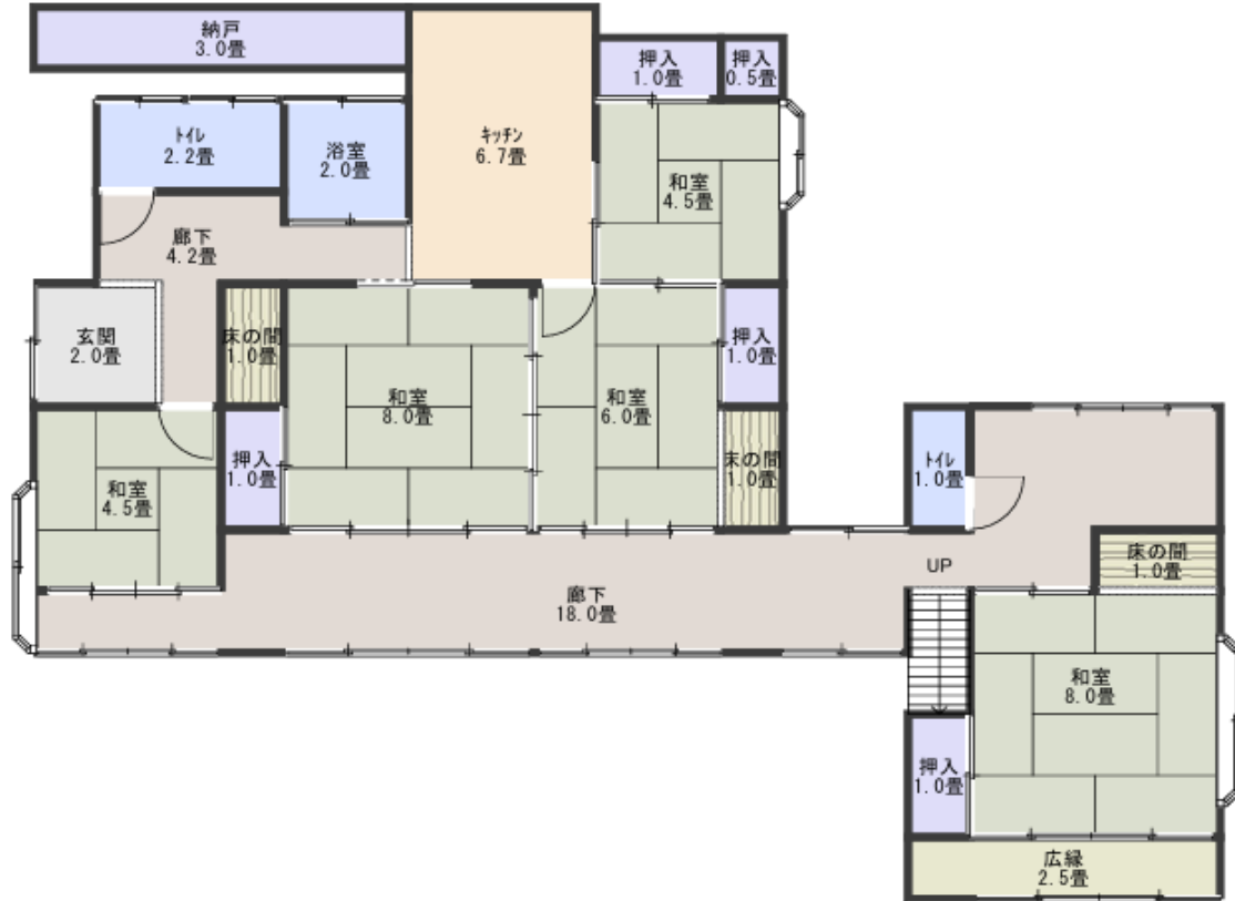
1階 縮尺 1/150