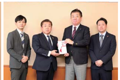
▲株式会社サンライズ様