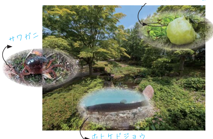
モリアオガエルの卵

※3 2030年までに、陸と海の30%以上を健全な生態系として効果的に保全しようとする目標