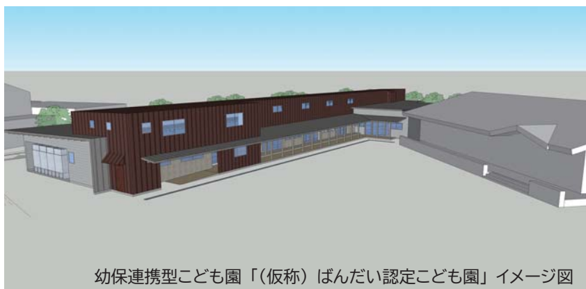
幼保連携型こども園「（仮称）ばんだい認定こども園」イメージ図

幼保連携型認定こども園とは、保育所と幼稚園を統合し、0歳から5歳までの子どもたちが同じ場所で過ごせる施設です。完成は令和8年度、開設は令和9年度を予定しています。