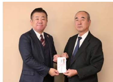
▲磐梯町ゴルフ愛好会様