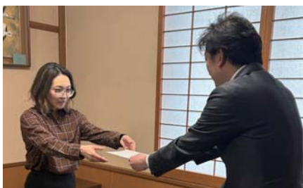
▶ 2025 年 4 月に委嘱状を拝受しました！とても緊張しました。