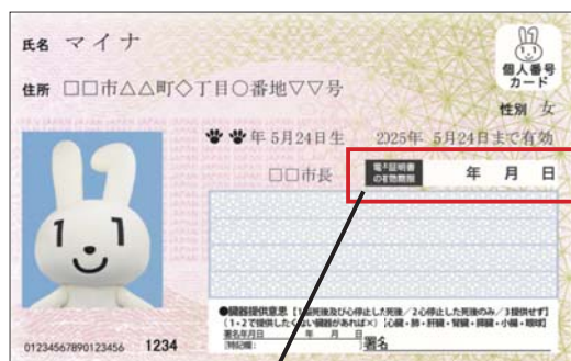
電子証明書の有効期限

電子証明書の有効期限が切れると、マイナンバーカードが有効であっても 健康保険証としての利用や各種申請ができなくなってしまう ます。電子証明書の有効期限の確認と更新手続きをお願いいたします。